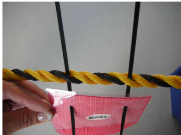
②シートの穴2ヶ所に取付けバンドを入れる。