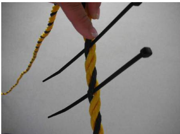
①横ずれを防ぐ為にロープのねじれを利用して取付けバンドを2本挟み入れる。