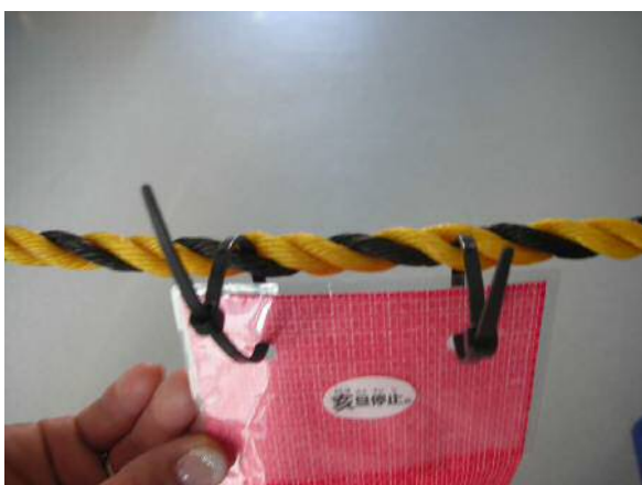
③ロープにしっかりと固定して留める。 取付けバンドの差し込む方向を確認する。